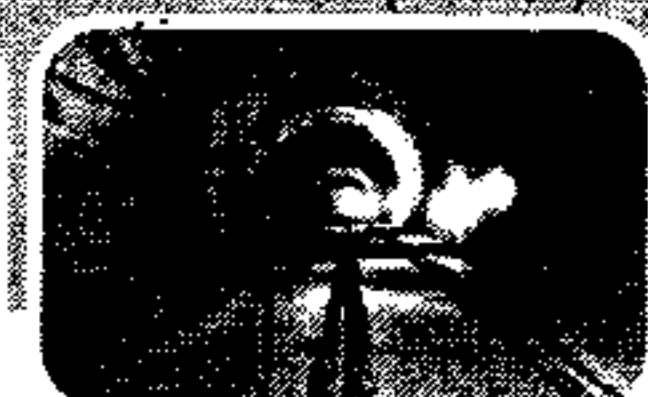
Pir Panjal Tunnel, Jammu & Kashmir