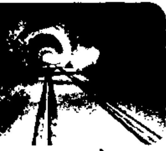
ल सुरंग, जम्मू और कश्मीर